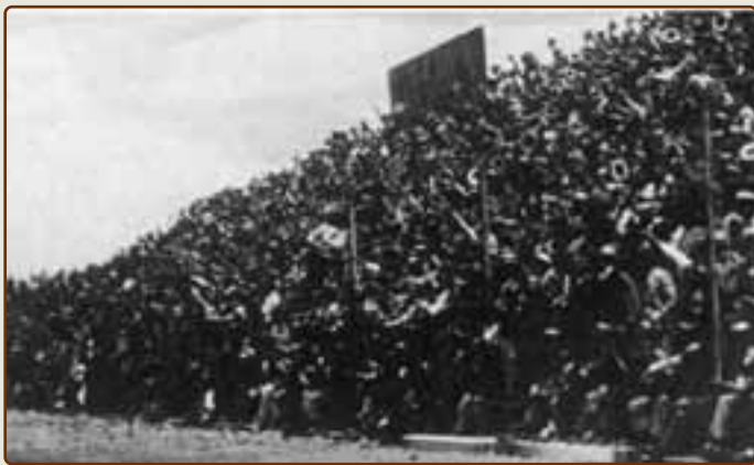
Матч Мексика — Куба (5:0) 11 марта 1934 года собрал на "Парке Некакса" в Мехико рекордные для того времени 22 тысячи зрителей