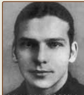
"Мучо" Фрихерио (Швейцария)

ЮГОСЛАВЫ, полуфиналисты первого мундиала, считались вместе со швейцарцами, финалистами Олимпиады-24,