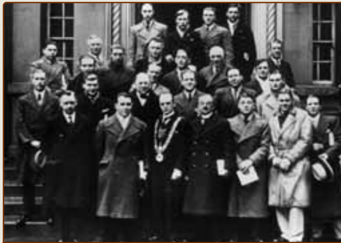
Делегация сборной Бельгии прибыла в Дублин