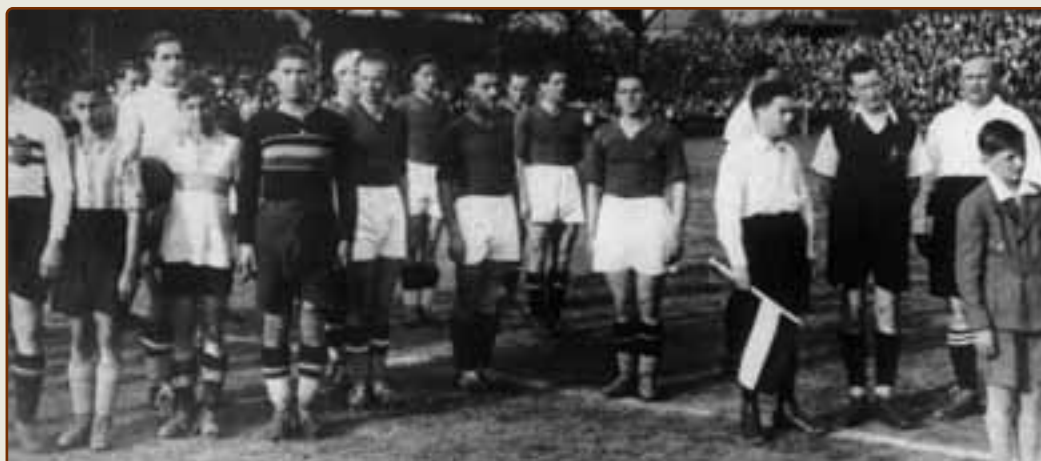
Венгрия — Болгария. Звучит болгарский гимн

К 16-й минуте первого матча мексиканцы вели уже 3:0. Все три гола в 4-минутном промежутке забил Ничо Мехия. Это и поныне самый быстрый хет-трик в истории чемпионатов мира. Итоговый результат, однако, получился