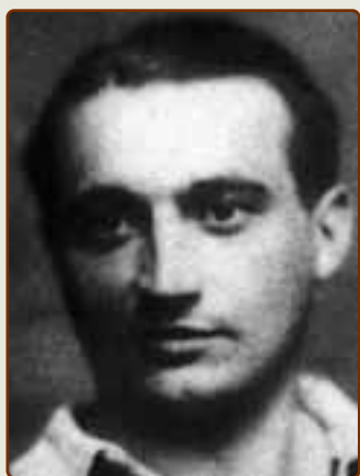
Штефан Добай — один из сильнейших нападающих в истории румынского футбола

Поднять дух патриотизма у футболистов и зрителей вызвался принц Румынии Михаил. В сопровождении 11-ти юношей, одетых в голубые костюмы, он