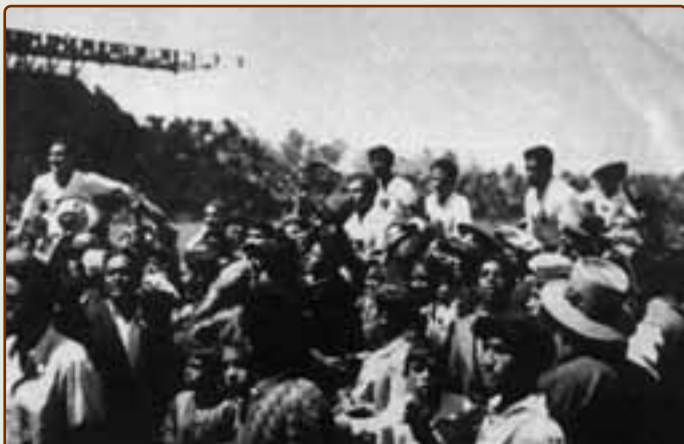
Эйфория мексиканских фанов после разгрома кубинцев