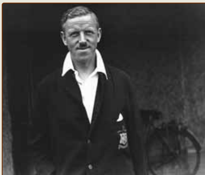
Стэнли Роуз – в будущем президент ФИФА, а в 30-е годы – футбольный арбитр