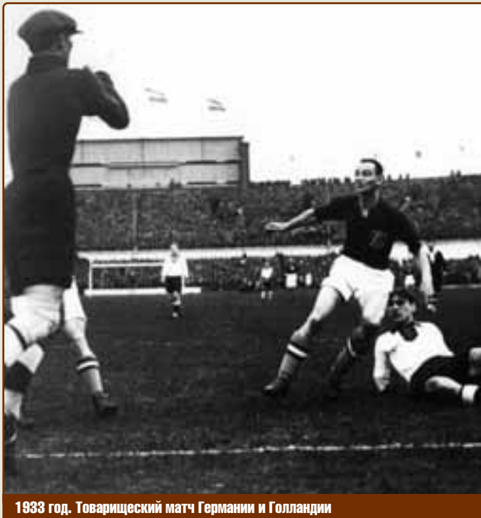
1933 год. Товарищеский матч Германии и Голландии