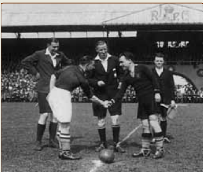
Бельгия – Голландия. Рукопожатие капитанов. В центре – судья Стэнли Роуз