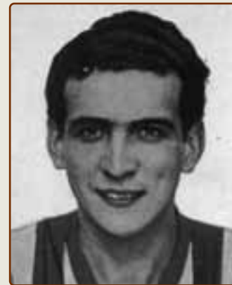
Восходящая звезда мексиканского футбола — "Пирата" Фуэнте