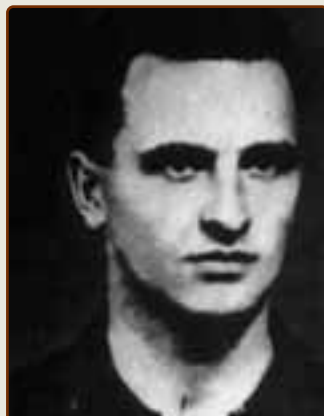
Дьердь Сюч (Венгрия)