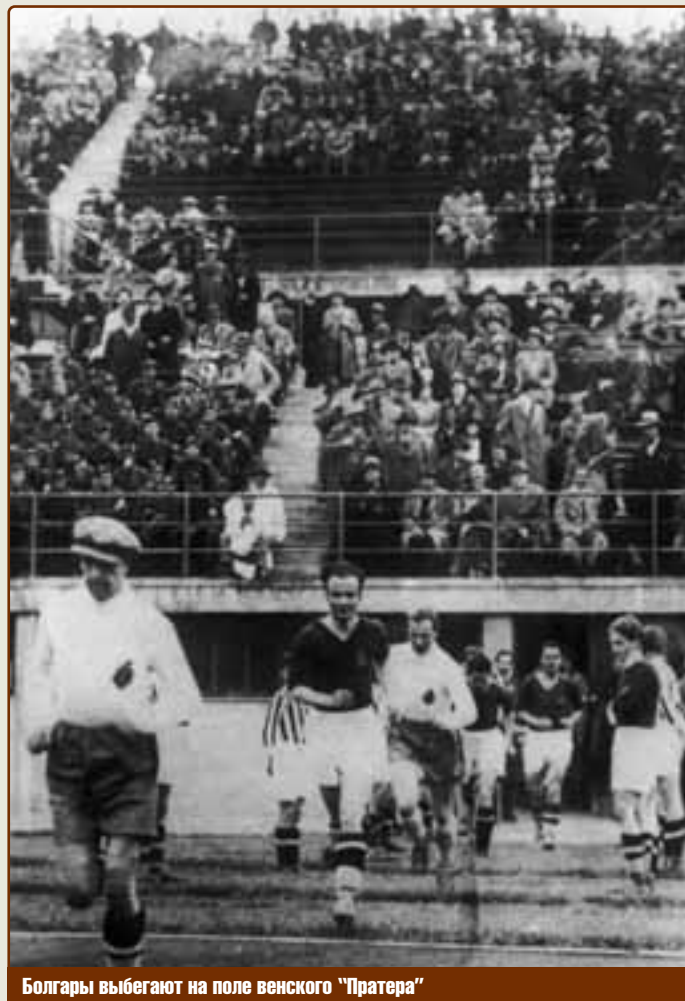
Болгары выбегают на поле венского "Пратера"