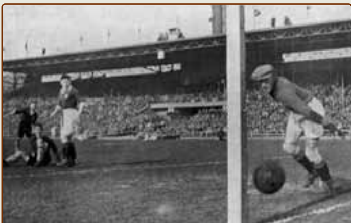
Беп Баххаус сидя наблюдает, как мяч пересекает линию ворот Ирландии

Потеряв равновесие, он позволил мячу закатиться в сетку, а шведский судья Ульссон гол засчитал.