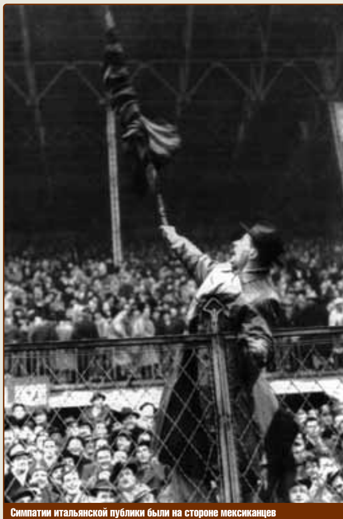
Симпатии итальянской публики были на стороне мексиканцев